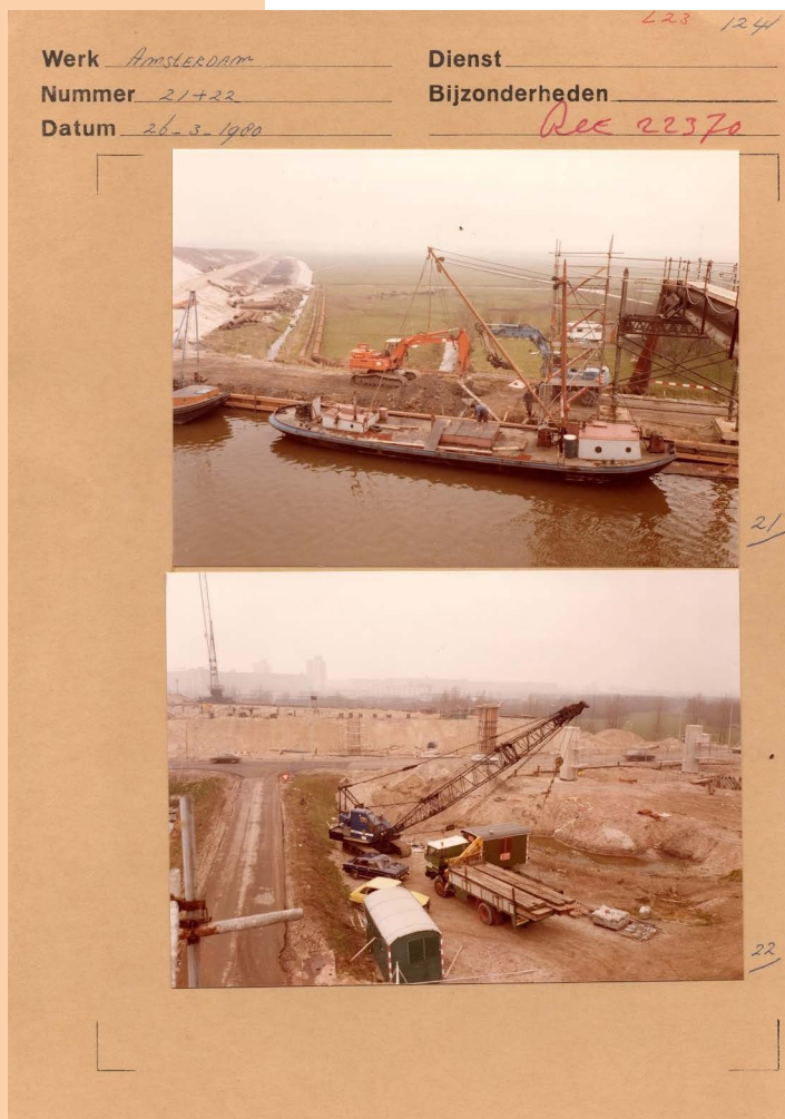
Negatievenblad, Beeldarchief Rijkswaterstaat. Originele foto's door fotograaf Henri Cormont.

Eigenlijk is zijn werk procesmatig, is steeds in ontwikkeling. Onderzoek vormt een vast bestanddeel van zijn benadering. Hij kijkt bijvoorbeeld naar een landschap in zijn historische wording en is niet bang te spreken van een 'disciplined landscape'.